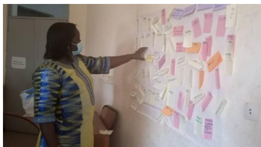
Atelier de mapping dans la région du Plateau Central