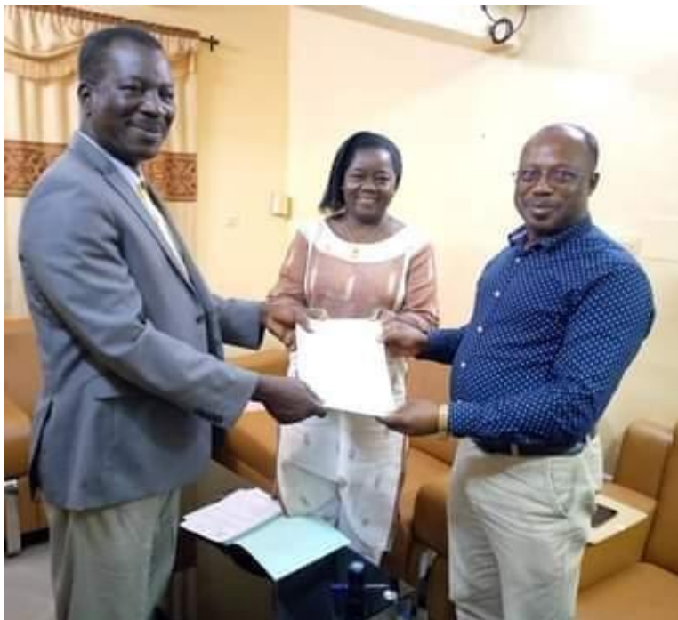
Signature de convention entre les 3 partenaires de mise en œuvre du PAGL-MS

PROJET D'APPUI A LA BONNE GOUVERNANCE LOCALE DANS LES SECTEURS DES MINES ET DE LA SECURITE