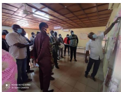
Atelier de mapping dans la région de la Boucle du Mouhoun