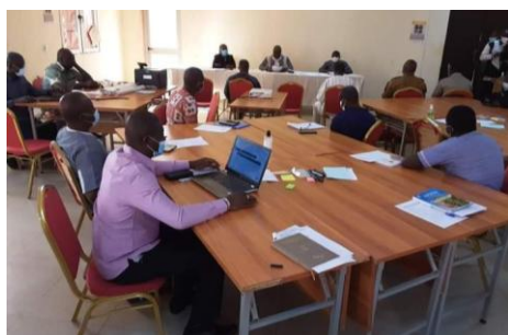
Atelier de mapping de la région du Centre Nord

L'atelier de réalisation du mapping des acteurs de la région du Plateau Central a eu lieu le 28 janvier 2021 à Ziniaré.